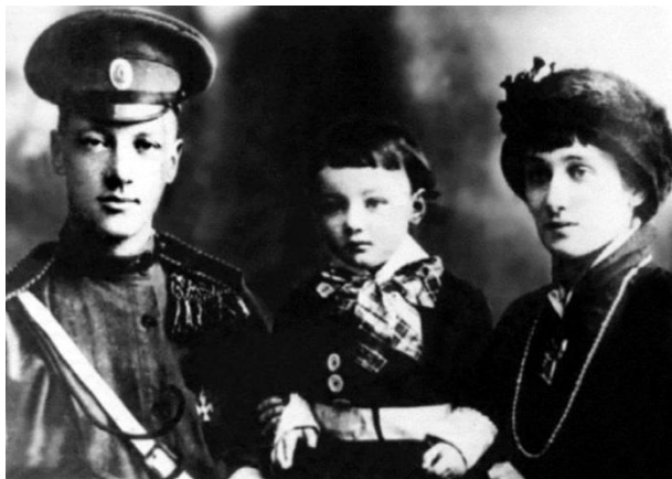
Анна Ахматова и Николай Гумилев с сыном Левой. 1915 г.

В Киеве Анна начала переписываться с Николаем Гумилевым, который ухаживал за ней еще в Царском Селе. В это время поэт находился во