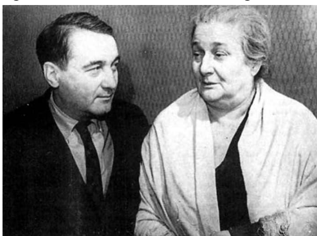
Анна Ахматова и Лев Гумилев. 1960-е гг.

В 1962 году поэтесса завершила работу над «Поэмой без героя» , которую писала в течение 22 лет. Как заметил поэт и мемуарист Анатолий Найман, «Поэма без героя» написана Ахматовой поздней об Ахматовой ранней — она вспоминала и размышляла об эпохе, которую застала.