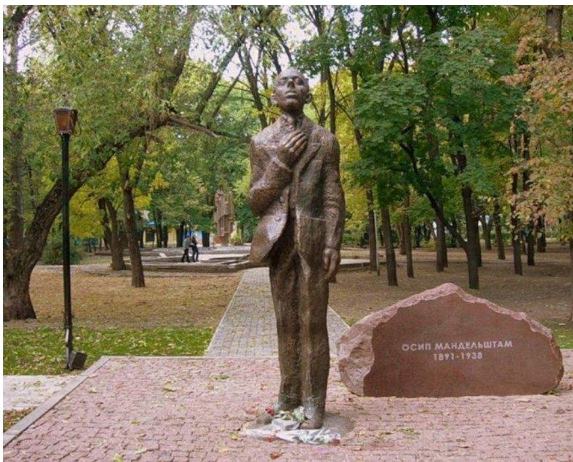
Памятник Осипу Мандельштаму

Когда срок ссылки закончился и Мандельштамы переехали в Калинин, поэта вновь арестовали. Его приговорили к пяти годам лагерей за контрреволюционную деятельность и отправили этапом на Дальний Восток. В 1938 году Осип Мандельштам умер, по одной из версий, в больничном лагерьном бараке недалеко от Владивостока. Причина его смерти и место захоронения доподлинно неизвестны.