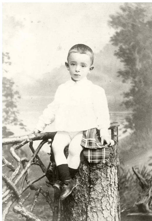
Осип Мандельштам в детстве

В 1897 году семья переехала в Петербург. Родители хотели дать детям хорошее образование и познакомить их с культурной жизнью Северной столицы, поэтому Мандельштамы жили между Петербургом и Павловском. Со старшим сыном Осипом занимались гувернантки, он с раннего детства учил иностранные языки.