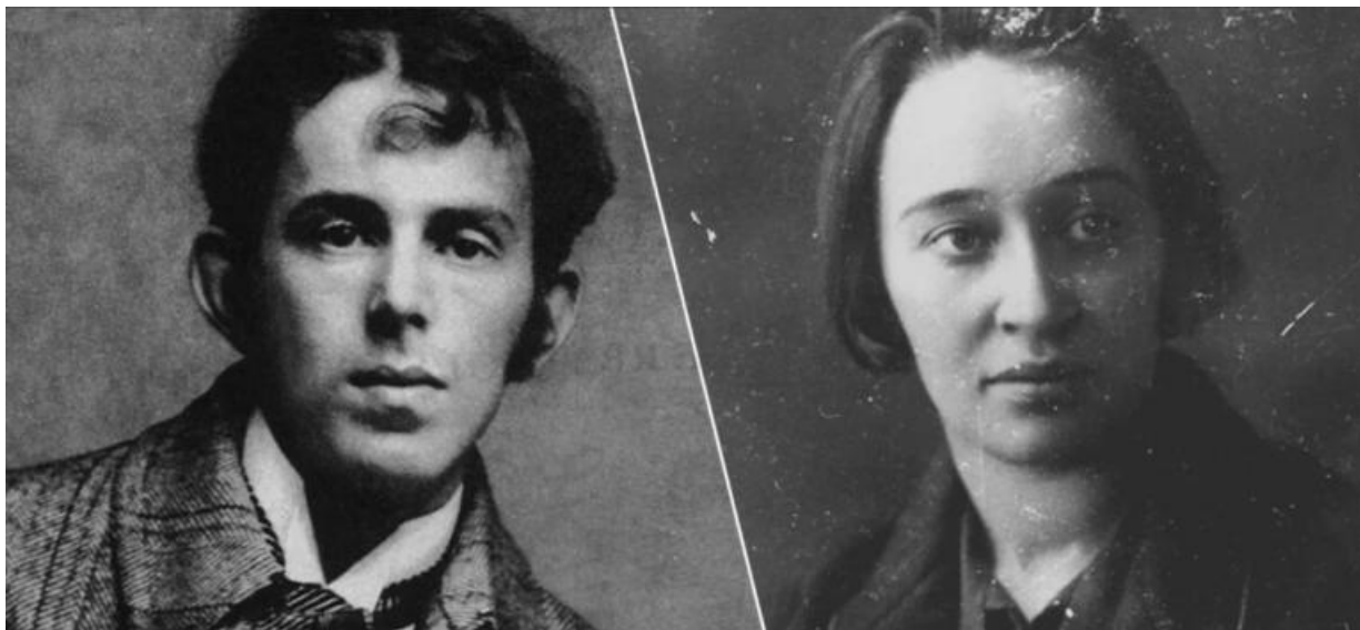
Осип Мандельштам с Надеждой Хазиной

Осип продолжает плодотворно работать. Из-под его пера в те годы выходят произведения «Сумерки свободы» , «Телефон», «За то, что я руки твои не сумел удержать...» .