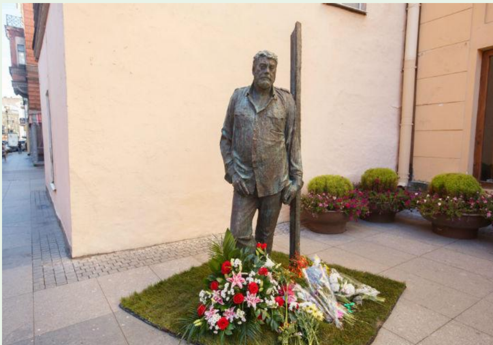
Памятник С. Д. Довлатову в Санкт-Петербурге. Скульптор В. Б. Бухаев

Антиномиями довлатовской прозы являются понятия «норма» и «абсурд». Иногда прозаик называет мир «абсурдным», но иногда — «нормальным». По Довлатову, жизнь человеческая абсурдна, если мировой порядок нормален. Но и сам мир абсурден, если подчинен норме, утратил качество изначального хаоса.