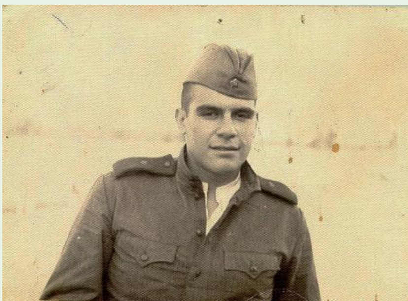
С. Д. Довлатов. Армейские годы (1962-1965 гг.)