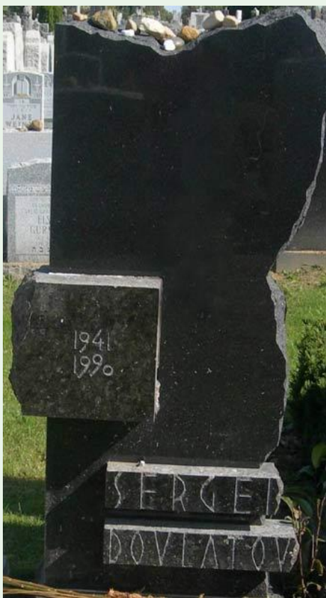
Могила С. Д. Довлатова на кладбище «Маунт Хеброн» в Нью-Йорке

Сергей Донатович Довлатов умер в возрасте 49 лет 24 августа 1990 года от сердечной недостаточности, в машине скорой помощи по дороге в больницу. Похоронен в Нью-Йорке на кладбище «Маунт Хеброн» (Mount Hebron Cemetery).