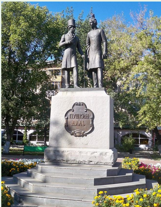
Памятник В. И. Далю и А. С. Пушкину в Оренбурге

человека из народа перед законом, перед устоями общества. В 1853 по заказу великого князя Константина Даль выпускает сборник «Матросские досуги» («Солдатские досуги» были напечатаны в 1843), оба сборника предназначались для простого народа и пользовались большим успехом. В это время Даль уже был управляющим удельной конторой в Нижнем Новгороде (с 1849 по 1859). Служба в столице тяготила Даля, хотя он и был правой рукой Л. А. Перовского, неохотно отпустившего его в Нижний. Хорошие отношения между ними сохранились, что видно из переписки, где Даль часто обращается к Л. А. Перовскому с просьбами помочь крестьянам Нижегородской губернии. В течение всей своей многолетней службы Даль очень добросовестно исполнял свои обязанности, искренне любил крестьян и всегда стремился помочь им в решении отдельных вопросов. Вскоре после смерти Л. А. Перовского (1856) Даль по состоянию здоровья и из-за конфликта с новым министром подает в отставку и поселяется в 1859 в Москве.