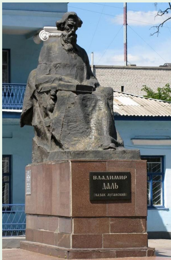
Памятник В. И. Далю в Луганске

Даль вошел в историю нашей культуры, прежде всего, как создатель «Толкового словаря живого великорусского языка», отразившего с исключительной полнотой словарный состав языка XIX века. Словарь Даля выдержал 6 изданий. Богатством материала труд Даля превышает все, что когда-нибудь у нас было сделано силами одного лица.