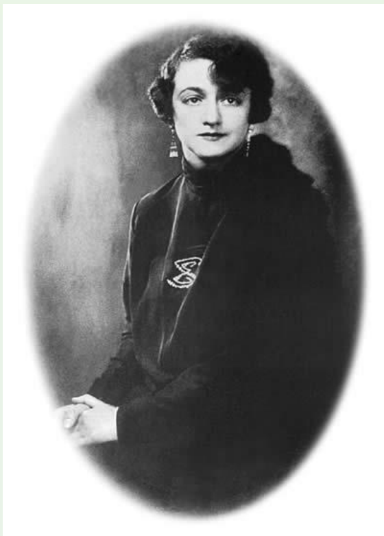
Елена Сергеевна Булгакова, третья жена М. А. Булгакова, 1928 г.

Елене Сергеевне предназначено было стать и его вдохновительницей, и прототипом героини. Познакомились Булгаков и Елена Сергеевна в доме у общих знакомых в 1929 году. Она – благополучная жена крупного советского военачальника, к тому же и красавца, он – драматург, терпящий творческое крушение, когда под овации критики одна за другой убирались со сцены его пьесы. Вот как вспоминает их встречу сама Елена Сергеевна: «Это была быстрая, необычайно быстрая, во всяком случае с моей стороны, любовь на всю жизнь».