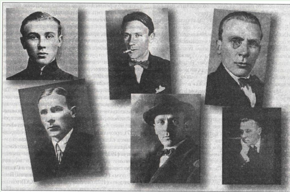
Михаил Афанасьевич Булгаков в разные годы жизни

Врачебная практика молодого Булгакова нашла отражение в цикле рассказов «Записки юного врача» (1925–1927 гг.).