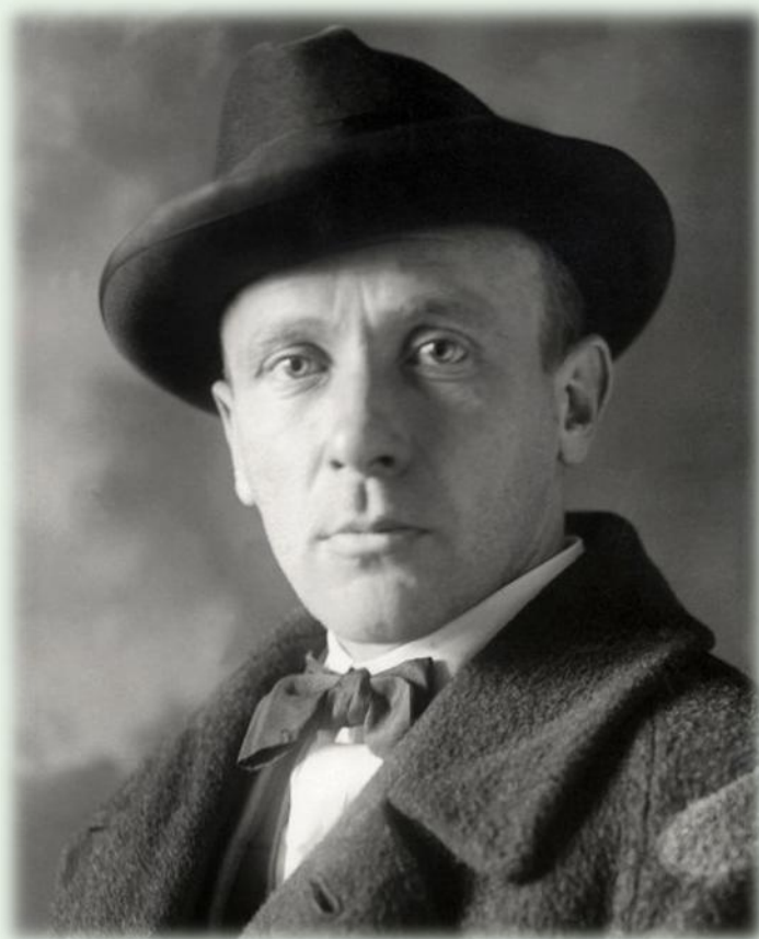
М. А. Булгаков

(3 (15) мая 1891 – 10 марта 1940), русского писателя, драматурга, театрального режиссёра и актёра