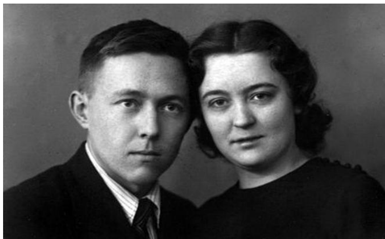
А. И. Солженицын с первой женой – Натальей Решетковской

Он рвется на фронт, однако после мобилизации в октябре 1941 г. попадает в тыловой батальон. Лишь после окончания артиллерийских курсов в Костроме, уже в звании лейтенанта, Солженицын в действующей армии и с конца 1942 г. по январь 1945 г. со своей