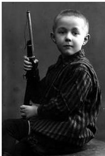
А. И. Солженицын в детстве

В 1924 г. мать переехала в Ростов-на-Дону, где вырастила сына «в невероятно тяжелых условиях». В школьные годы и после, когда он учился на физико-математическом факультете Ростовского университета (1936–1941 гг.), открытая, жизнелюбивая, энергичная натура Солженицына была во многом захвачена современной «советской действительностью»; он искренне принимает