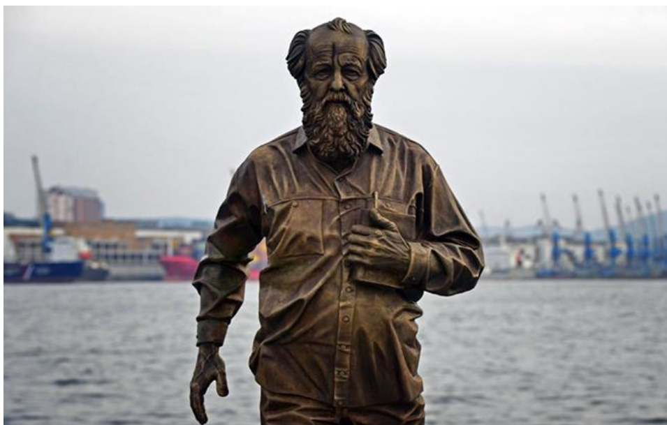
Памятник А. И. Солженицыну на Корабельной набережной Владивостока

Скончался писатель 3 августа 2008 г. в своем доме в Троице-Лыкове от острой сердечной недостаточности. Похоронен на кладбище Донского монастыря в Москве.