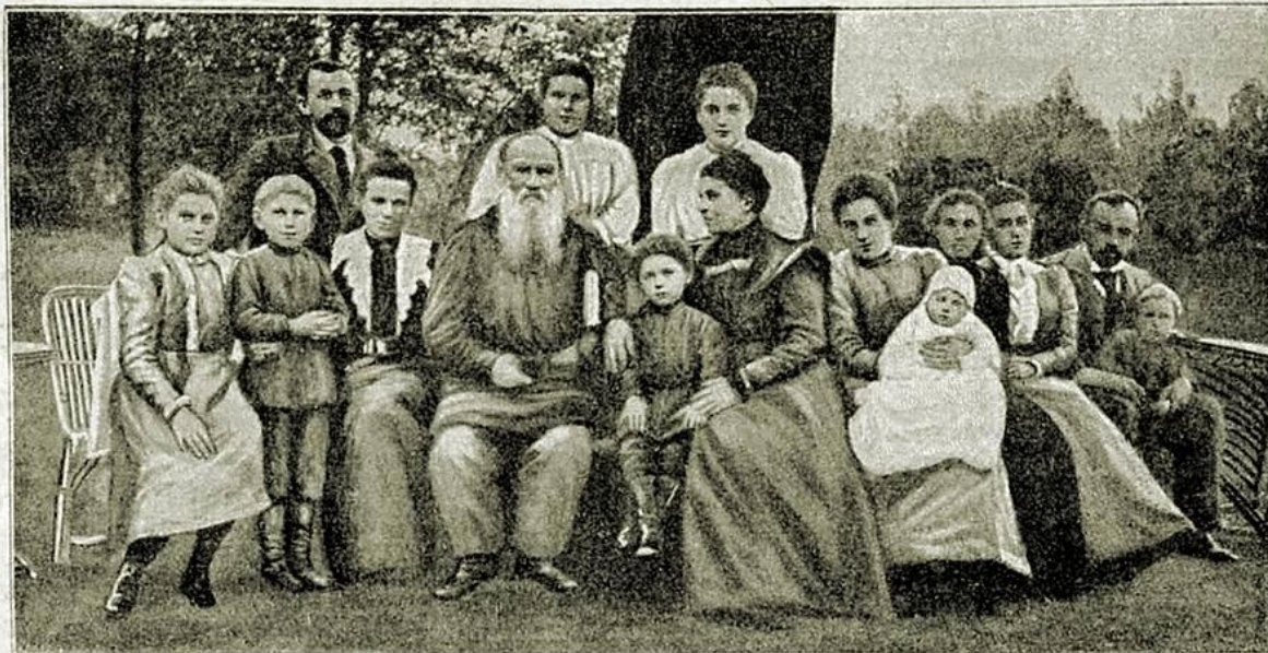
Л. Н. Толстой в кругу семьи.

В 1856 году, еще до отмены крепостного права, писатель попытается освободить своих крестьян от крепостной зависимости. Крестьяне на это не пошли, подозревая Толстого в хитрости и обмане, и, ожидая указа свыше, надеясь, что будут освобождены с землей. Это не поколебало веры Толстого в самоусовершенствование. Он занялся крестьянской педагогикой: открыл яснополянскую школу для крестьянских детей, где сам проводил занятия, издавал журнал «Ясная Поляна», писал учебники, народные рассказы, в 1861–1862 годах ездил в Германию, Францию, Бельгию, Англию, Италию за педагогическим опытом.