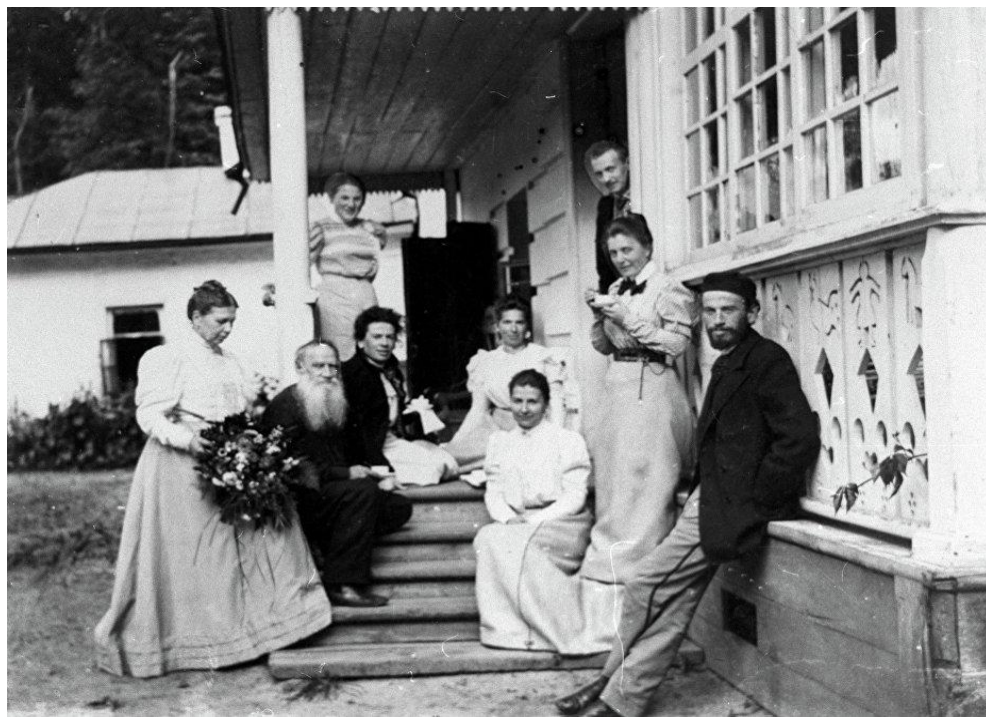
Лев Толстой с семьей в музей-усадьбе «Ясная поляна»

русско-турецкая война. В 1854 году короткий период Толстой служил в Дунайской армии, участвовал в осаде турецкой крепости Силистрии, а затем подал рапорт о переводе в Крымскую армию. Участвуя в обороне Севастополя как командир артиллерийской батареи на самом опасном