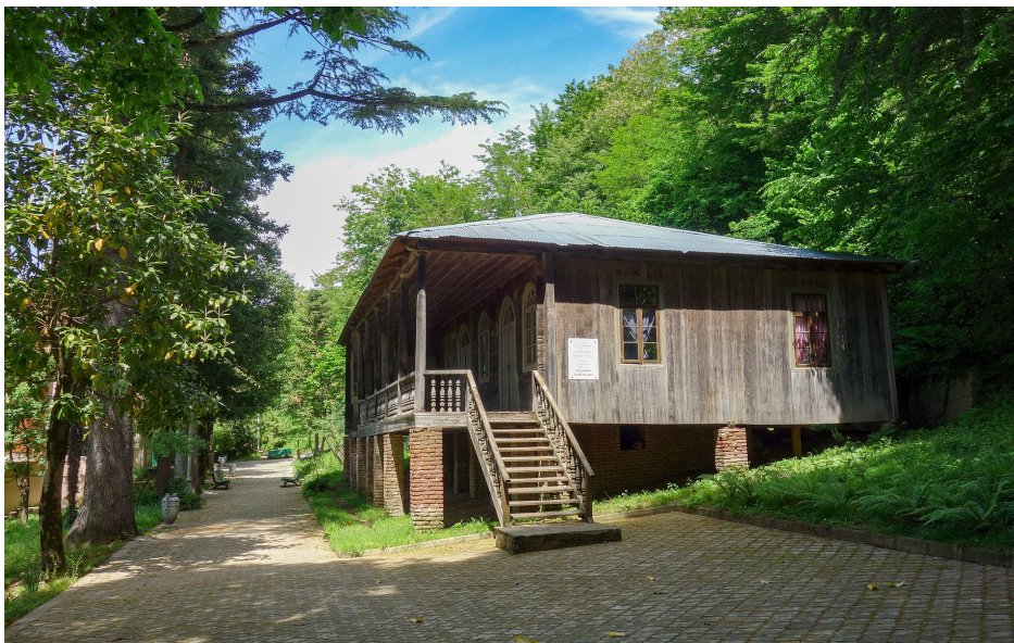
Дом, где родился В. В. Маяковский

14 апреля 1930 года, оставив прощальное письмо, поэт совершил самоубийство в своей квартире в Москве. Могила Маяковского находится на Новодевичьем кладбище.