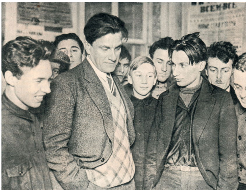
Маяковский на своей выставке «20 лет работы»

В Москве Маяковский познакомился с революционно настроенными студентами, начал увлекаться марксистской литературой, в 1908 году вступил в РСДРП. Был пропагандистом в торгово-промышленном подрайоне, в 1908-1909 годах трижды арестовывался (по делу о подпольной типографии, по подозрению в связи с группой анархистов-экспроприаторов, по подозрению в пособничестве побегу женщин-политкаторжанок из Новинской тюрьмы). По первому делу был освобождён с передачей под надзор родителей по приговору суда как несовершеннолетний, действовавший «без разума», по второму и третьему делу был освобождён за недостатком улик. В тюрьме Маяковский «скандалил», в Бутырской тюрьме он провёл 6 месяцев в одиночной камере. В тюрьме в 1909 году Маяковский снова стал писать стихи.