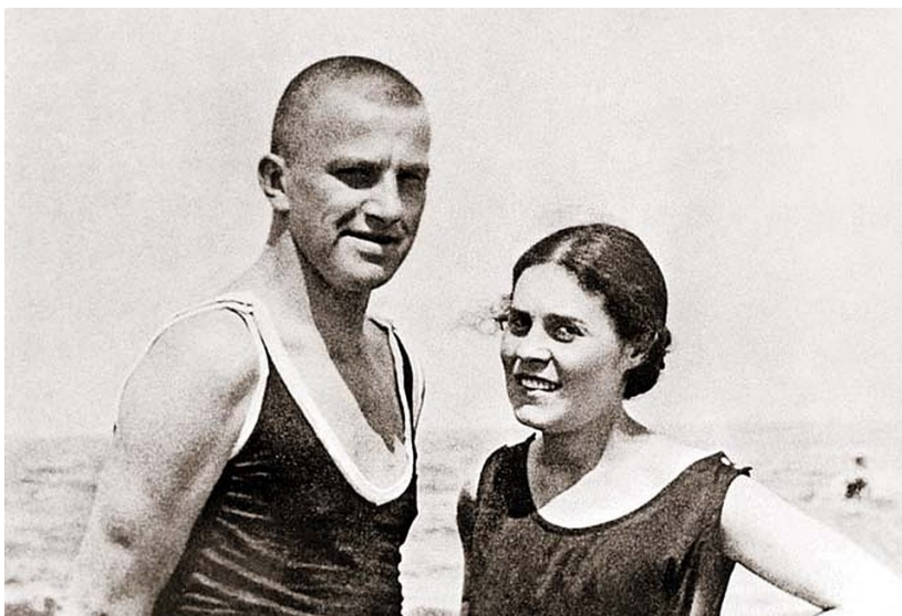
Владимир Маяковский и Лиля Брик

Маяковский в 1918 году снимался в трёх фильмах по собственным сценариям. В августе 1917 года задумал написать «Мистерию Буфф»,