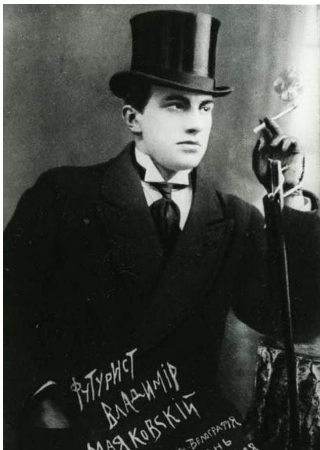
В. В. Маяковский