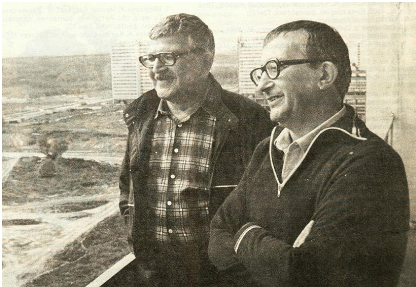
Аркадий и Борис Стругацкие

Аркадий Натанович [28.8.1925 – 12.10.1991], Борис Натанович [15.4.1933 – 19.11.2012], прозаики, публицисты, сценаристы, переводчики