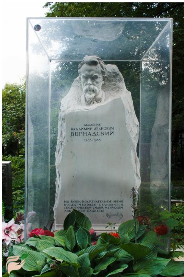
Могила В. И. Вернадского, Москва

Владимир Иванович Вернадский скончался 6 января 1945 года в Москве, похоронен на Новодевичьем кладбище.