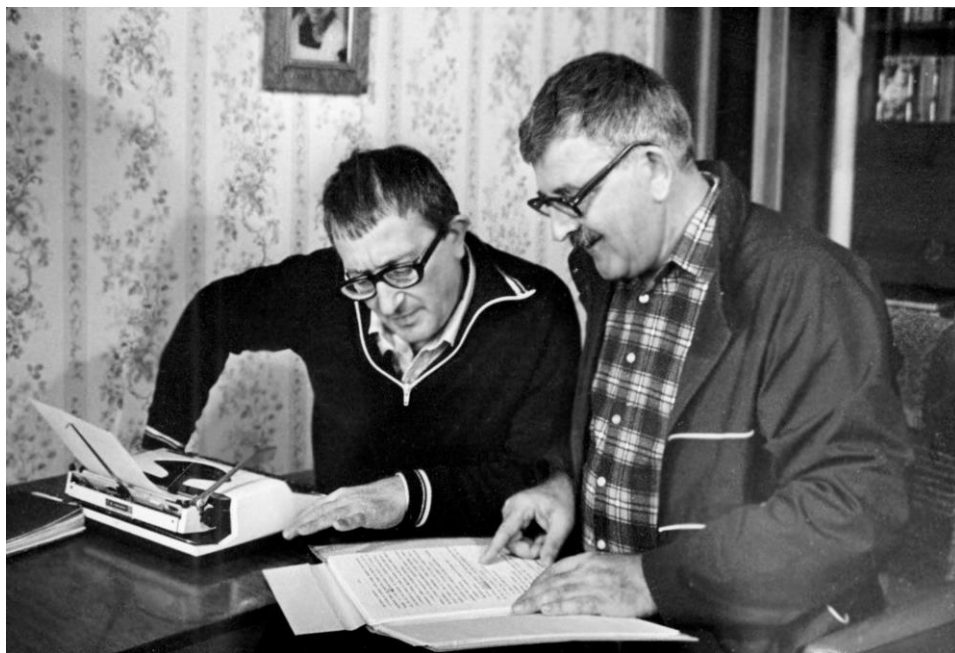
Братья Стругацкие за работой

Борис Натанович Стругацкий скончался 19 ноября 2012 года, был кремирован.