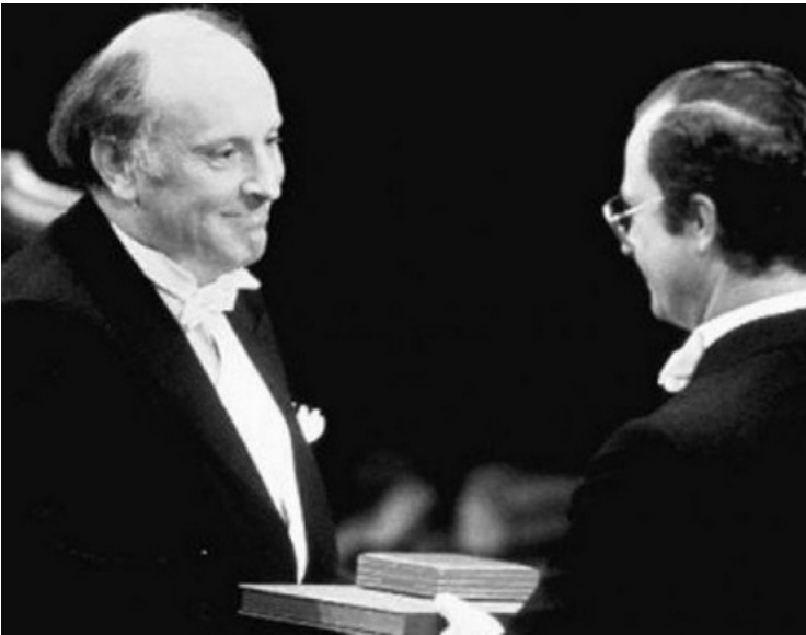
Иосиф Бродский на вручении Нобелевской премии

приглашенного литератора. В 1977 г. Бродский получил американское гражданство. При его жизни было издано пять поэтических сборников, содержащих переводы с русского на английский и стихи, написанные им по-английски. Но на Западе Бродский прославился прежде всего как автор многочисленных эссе. Сам себя он определял как «русского поэта, англоязычного эссеиста и, конечно, американского гражданина» . Образцом его зрелого русскоязычного творчества стали стихотворения, вошедшие в сборники «Часть речи» (1977 г.) и «Урания» (1987 г.).