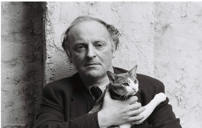
Иосиф Бродский со своим котом