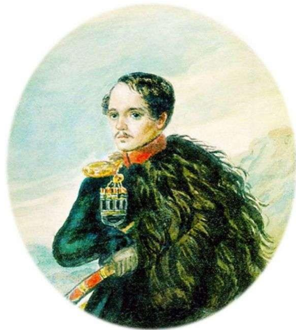
М. Ю. Лермонтов. Автопортрет. 1837-1838.

По окончании Школы в 1834 г. Лермонтов был определен в лейб-гвардии гусарский полк, стоявший в Царском Селе. Однако большую часть времени молодой гусар проводил в столице, впервые почувствовав себя свободным и погрузившись в светские развлечения. Его критические наблюдения над жизнью аристократического общества легли в основу драмы «Маскарад» (1835), которую Лермонтов переделывал