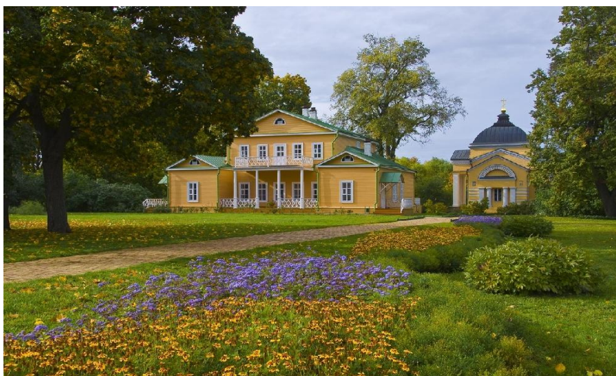
Тарханы. Государственный Лермонтовский музей-заповедник

подножия Машука состоялась дуэль, закончившаяся трагической гибелью поэта. Все обстоятельства дуэли, весьма запутанные участниками (секунданты — М. П. Глебов, А. И. Васильчиков, А. А. Столыпин, С. В. Трубецкой), но тщательно изученные в советское время, показывают, что ее следует рассматривать как преднамеренное и хорошо подготовленное убийство. Похороны состоялись 17 июля на городском кладбище «при стечении всего Пятигорска», с участием представителей всех полков, в которых служил поэт. Позднее гроб с телом Лермонтова был перевезен в Тарханы и 23 апреля 1842 г. погребен в семейном склепе Арсеньевых. В 1899 г. в Пятигорске открыт памятник Лермонтову, воздвигнутый по всероссийской подписке.