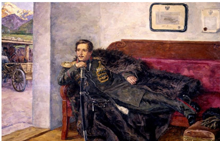
Портрет М. Ю. Лермонтова. Художник Петр Кончаловский. 1943

«Герой нашего времени» распространялся в те дни, когда Лермонтов был предан военному суду и находился в заключении за дуэль с сыном французского посла в Петербурге Э. Барантом. Эта дуэль, состоявшаяся 18 февраля, окончилась ничем и могла бы остаться незамеченной. Однако власти поспешили использовать незначительный сам по себе эпизод как повод для расправы с непокорным поэтом. Военный суд, согласно прямому указанию Николая I, приговорил Лермонтова к вторичной ссылке на Кавказ, в Тенгинский пехотный полк, готовившийся к сложным военным операциям. Царь не скрывал своей ненависти к поэту и внимательно следил за его