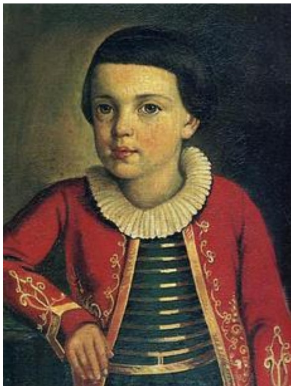
Портрет М. Ю. Лермонтова. 1820-1822. Художник неизвестен.