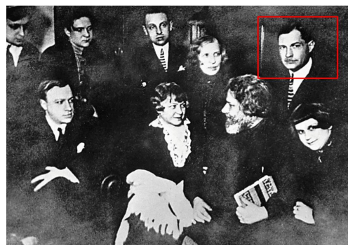
Е. И. Замятин в Союзе писателей

После Февральской революции Замятин вернулся в Петроград, а после Октябрьской стал одной из самых заметных фигур в российской литературной жизни. В Политехническом институте писатель преподавал технические дисциплины, читал курс новейшей русской литературы в