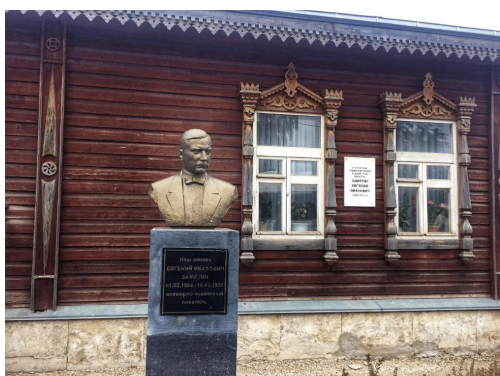
Памятник у Дома-музея Е. Замятина. г. Лебедянь Липецкой области

Экранизация пьесы Горького « На дне » была признана лучшим фильмом Франции (1936). Писателю хватало гонораров на безбедную жизнь и на помощь М. Булгакову, А. Ахматовой и другим советским писателям.