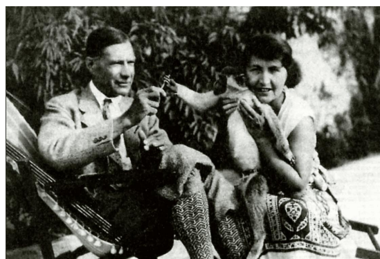
Евгений Замятин с женой Людмилой

Травля нестандартно мыслящего писателя достигла апогея в 1929-м, и он решился написать письмо Иосифу Виссарионовичу Сталину . В послании писатель попросил вождя разрешить ему выезд из СССР. Получив, наконец, в 1932-м г. согласие, Замятин с женой Людмилой Николаевной (урожденной Усовой) эмигрировал во Францию, где стал сотрудничать с ведущими парижскими изданиями. Евгений Иванович быстро обрел популярность как