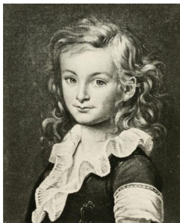
Проспер Мериме в детстве

Часть детской биографии Мериме прошла в области Далмация, куда его отец был распределен по службе. Здесь мальчик познакомился с народным фольклором, оставившим в его сердце глубокий след. В