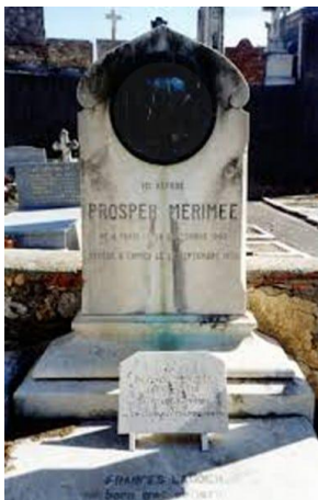
Могила Проспера Мериме

Знаменитого мастера похоронили на кладбище Гран-Жас в окрестностях Канн. Уже после кончины литератора был опубликован его сборник «Последние новеллы», а также письма к друзьям и возлюбленным.