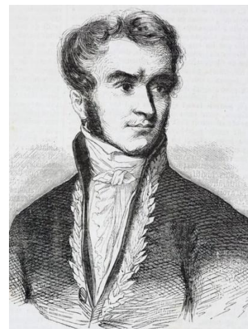
Портрет Проспера Мериме в молодости

Несмотря на успешную политическую карьеру, Мериме всерьез увлекся литературным творчеством. Небольшие рассказы он начал сочинять, будучи студентом, а вскоре представил публике дебютное серьезное произведение под названием «Кромвель». Работа была одобрена Стендалем, но автор отказался ее печатать.