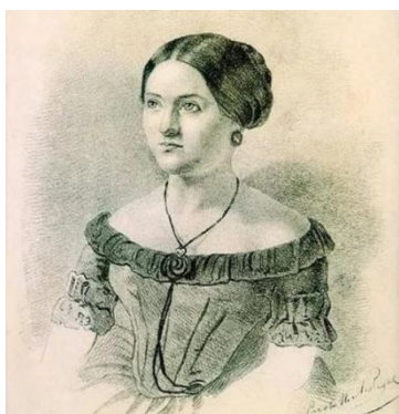
Любовь Павловна Никулина-Косицкая

В начале 1850-х годов, когда Островский работал в театре над постановкой «Не в свои сани не садись», он увлекся актрисой Любовью Никулиной-Косицкой. Артистка не ответила драматургу взаимностью, но дружба между ними продолжалась до самой смерти Косицкой. Она играла в девяти постановках Островского: Катерину в «Грозе» , Анну Ивановну в комедии «Бедность – не порок» , Вышневскую в «Доходном месте» и других.