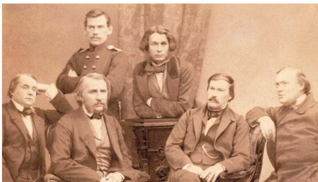
Группа писателей-авторов журнала «Современник». Слева направо: Лев Толстой, Дмитрий Григорович (верхний ряд); Иван Гончаров, Иван Тургенев, Александр Дружинин, Александр Островский (нижний ряд).

устава. Кружок помогал литераторам защищать права и требовать наказания для театров, которые ставили пьесы без разрешения драматургов. В 1881 году Александра Островского пригласили на заседание комиссии в Петербург по пересмотру Положения о театрах. К собранию