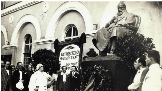
Открытие памятника Александру Островскому. 1929. Москва.

году император Александр III назначил писателю пенсию в три тысячи рублей. Вскоре государь определил драматурга «заведующим репертуарной частью московских театров»: Островский подбирал пьесы к постановкам и занимался с актерами.