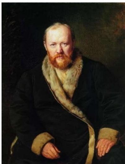
Александр Николаевич Островский

[12.04.1823 – 14.06.1886], русского драматурга