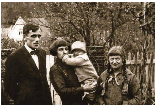
Марина Цветаева с мужем и детьми