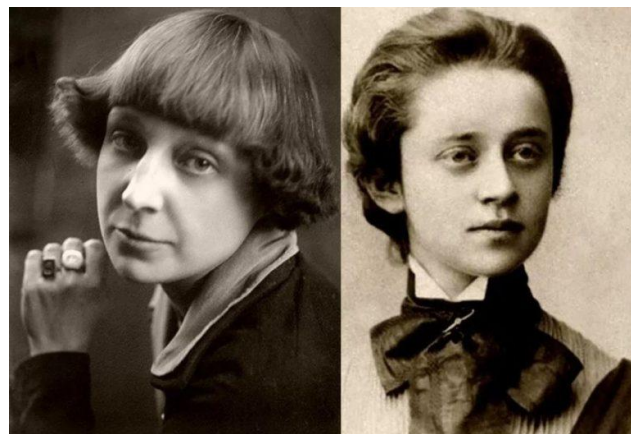
Марина Цветаева и София Парнок