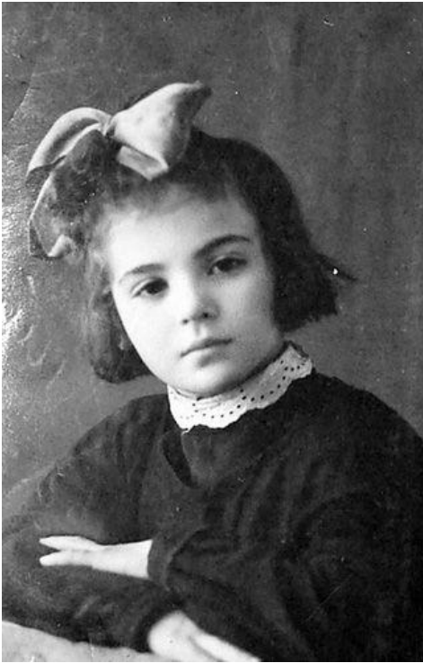
Марина Цветаева в детстве