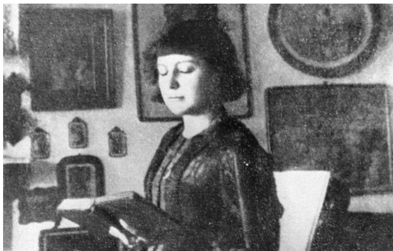
Марина Цветаева в эмиграции

Большинство из созданного Цветаевой в эмиграции осталось неопубликованным. В 1928 г. в Париже выходит последний прижизненный сборник поэтессы – «После России», включивший в себя стихотворения 1922-1925 гг.