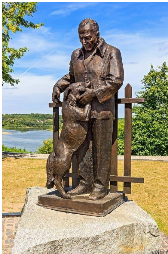
Памятник Константину Паустовскому

В последние годы жизни Константин Паустовский болел астмой, у него случилось несколько инфарктов. В 1968 году писателя не стало. Согласно завещанию, его похоронили на кладбище в Тарусе.