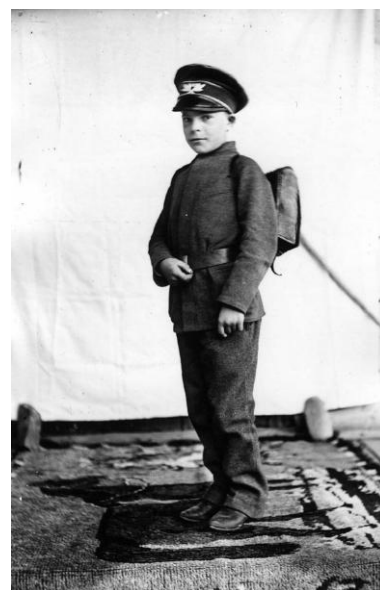
Константин Паустовский в детстве

В юности Константин Паустовский увлекался