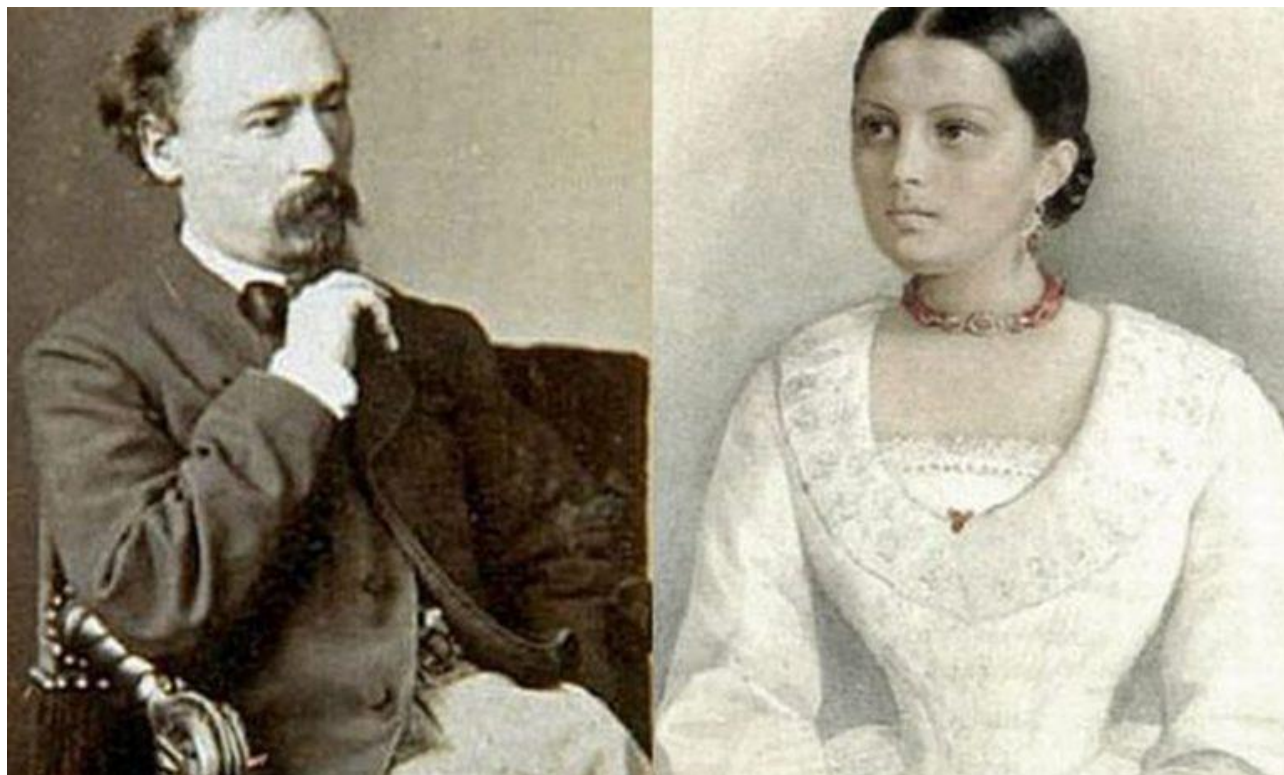
Николай Некрасов и Авдотья Панаева

запретов, Некрасов начал публиковать в нем главы из приключенческих романов «Мертвое озеро» и «Три страны света» , которые писал в соавторстве со своей гражданской женой Авдотьей Панаевой (она скрывалась под псевдонимом Н. Н. Станицкий).