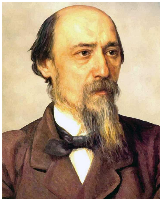
Н. А. Некрасов