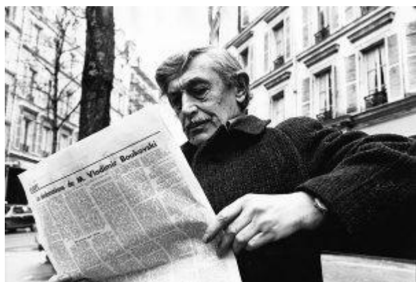
Виктор Некрасов в Париже

В последующие годы были написаны два романа: «Кира Георгиевна» и «В родном городе» , выпущен сборник рассказов о войне. За книгу «По обе стороны океана» писатель подвергся резкому обличению со стороны властей и был обвинен в идеализации Запада. Итогом этого послужило исключение из рядов КПСС. В это же время началась травля Некрасова. Ему отказывали все издательства, его клеймили на собраниях, объявляли строгие выговоры за то, что он посмел выразить мнение, не совпадающее с линией компартии.