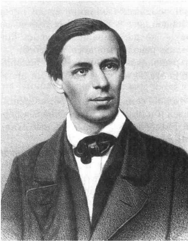
Аполлон Майков в молодости

живописи. Но всё же из-за близорукости, которой он страдал, выбирает поэзию. Так же этому выбору поспособствовала похвала его ранних произведений историка литературы Александра Никитенко и поэта Петра Плетнева.