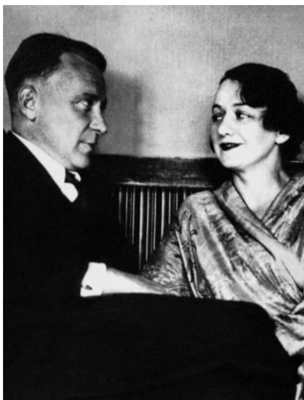
Михаил Булгаков с третьей женой – Еленой Шиловской. г. Москва, 1935 г.

В 1932 году Михаил Булгаков развелся с Любовью Белозерской и женился на Елене Шиловской. С ней писатель познакомился на вечере у друзей. Шиловская была замужем за высокопоставленным чиновником. Когда ее отношения с Булгаковым открылись, супруг Шиловской отказался давать развод и запретил видеться с писателем. Однако спустя год он сдался и разрешил жене уехать. Шиловская помогала Булгакову во всем: печатала под диктовку произведения, вела все его дела.