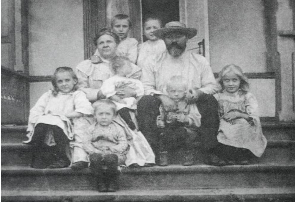
Михаил Булгаков (слева в верхнем углу) с семьей. 1902 г.

У Булгаковых часто звучала музыка. По вечерам мать играла на рояле произведения Фридерика Шопена. Иногда скрипку в руки брал отец, и родители вместе пели романсы. Детей часто водили на летние концерты в Купеческом саду над Днепром, старались достать билеты в оперу. На популярного в то время «Фауста» с Федором Шаляпиным в главной роли семья ходила несколько раз. Булгаковы также ставили благотворительные спектакли, в которых играли домочадцы. Представления проходили либо в приютах для инвалидов, либо в квартирах друзей.