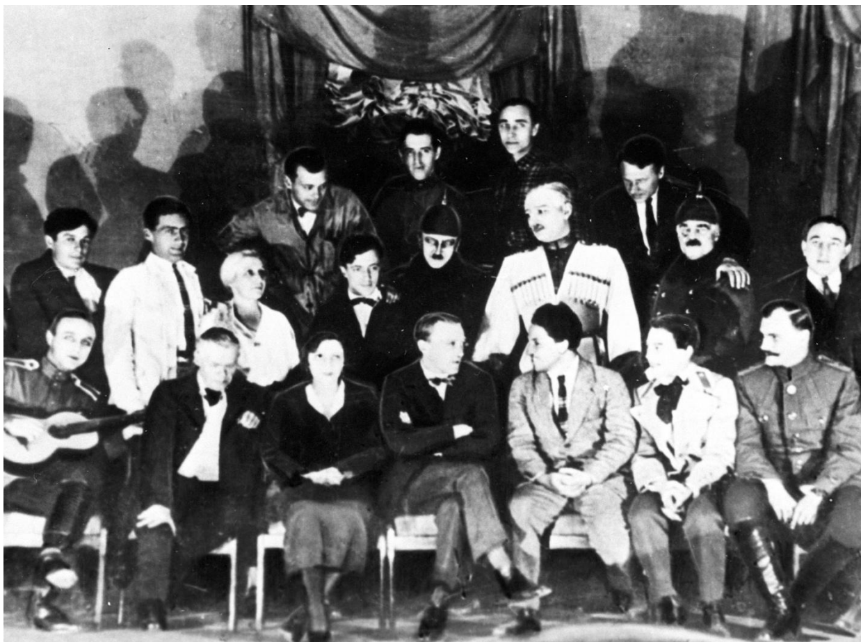
Михаил Булгаков (сидит в центре) с группой Московского художественного академического театра им. А. П. Чехова. г. Москва, 1926 г.