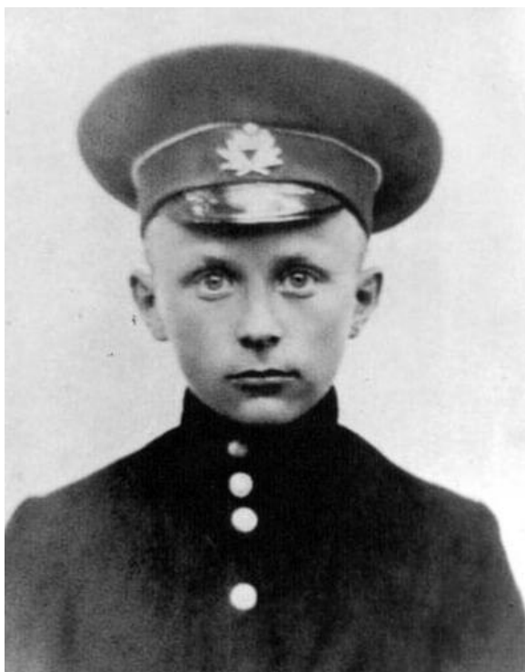
Михаил Булгаков в детстве