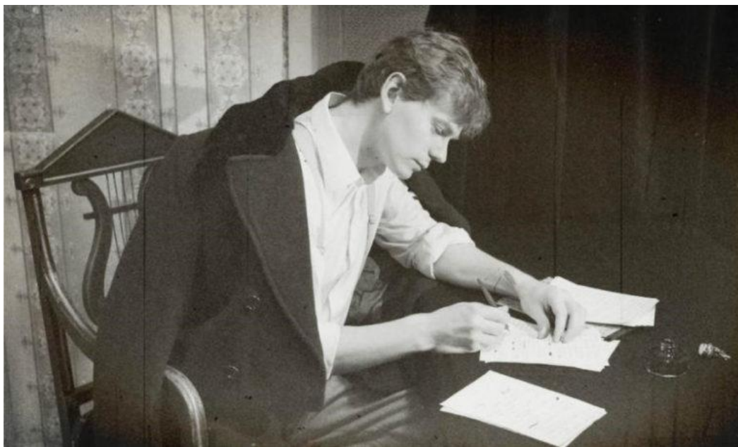
Сергей Есенин в процессе творчества

Лето 1915 г. поэт провел в родной деревне. Здесь он подготовил рукопись сборника «Радуница» , написал стихотворения «Белая свитка и алый кушак...» , «Разбойник» , повесть «Яр» , рассказы «Бобыль и Дружок» и «У белой воды» . Поэт собирал народные песни, сказки, частушки и загадки – позже они вошли в сборник «Рязанские побаски, канавушки и страдания».